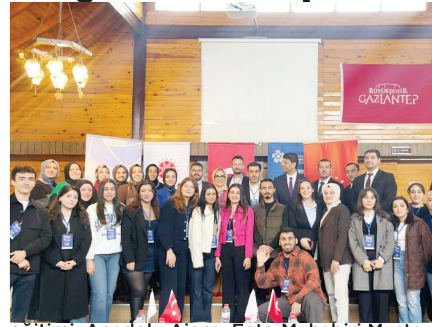
Foto muhabirliği ve çekim teknikleri