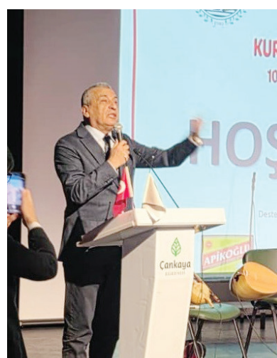
Gaziantep Dernekleri Federasyonu ve Ankara Gaziantepililer Derneği,

Gaziantepililerin kültürünü yurdun dört bir yanına tanıtmayı amaçlayan özel bir etkinliğe imza attı. Tören, Gaziantep'e Gazilik unvanının verilmesinin 105. yıldönümü vesilesiyle düzenlendi. Etkinlik, Ankara'da yaşayan Gaziantepililer başta olmak üzere, Türkiye'nin farklı bölgelerinden katılım sağlandı.