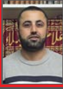
Gazeteci-Yazar Yusuf Öztekin