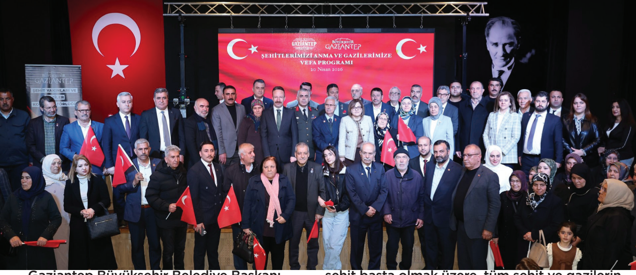
Gaziantep Büyükşehir Belediye Başkanı Fatma Şahin, Şehitler Haftası dolayısıyla şehit aileleri ve gazilerle bir araya geldi.

14-20 Nisan Şehitler Haftası kapsamında düzenlenen buluşma, 25 Aralık Kahramanlık Panoraması ve Müzesi Konferans Salonu'nda gerçekleştirildi. Programda şehitleri anan Başkan Şahin, gaziler ve şehit aileleriyle yakından ilgilenererek onlarla sohbet etti.