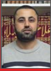
Gazeteci- Yazar Yusuf Özbek